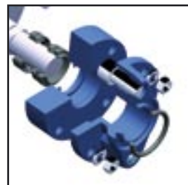
Štvoritý tesniaci systém