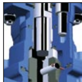
Tesniaca príruha vrchu posúvača

Pneumatický uzatvárací posúvač si nevyžaduje údržbu a je založený na rovnakom vysoko kvalitnom dizajne známom z bežných AVK uzatváracích posúvačov s plne vulkanizovaným klinom a výstelkou podľa DIN 30677.