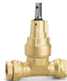
Závitové objímky odolné voči ťahu a AVK hlavica pre AVK zemné súpravy

Komplexné, pre užívateľa jednoduché a bezpečné riešenie pre všetky servisné prípojky!