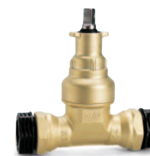
PRK spojky a hlavica v tvare T pre nórske zemné súpravy