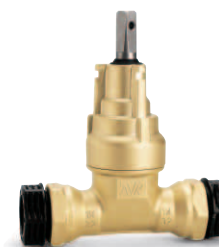
PRK spojky a AVK hlavica pre AVK zemné súpravy